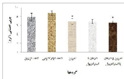
شکل ۳. میانگین وزن چربی احشایی در گروه‌های مختلف پس از هشت هفته

* تفاوت آماری در مقایسه با گروه شاهد اوارکتومی ( p < 0.05 ) † تفاوت آماری در مقایسه با گروه شاهد تزریق ( p < 0.05 )