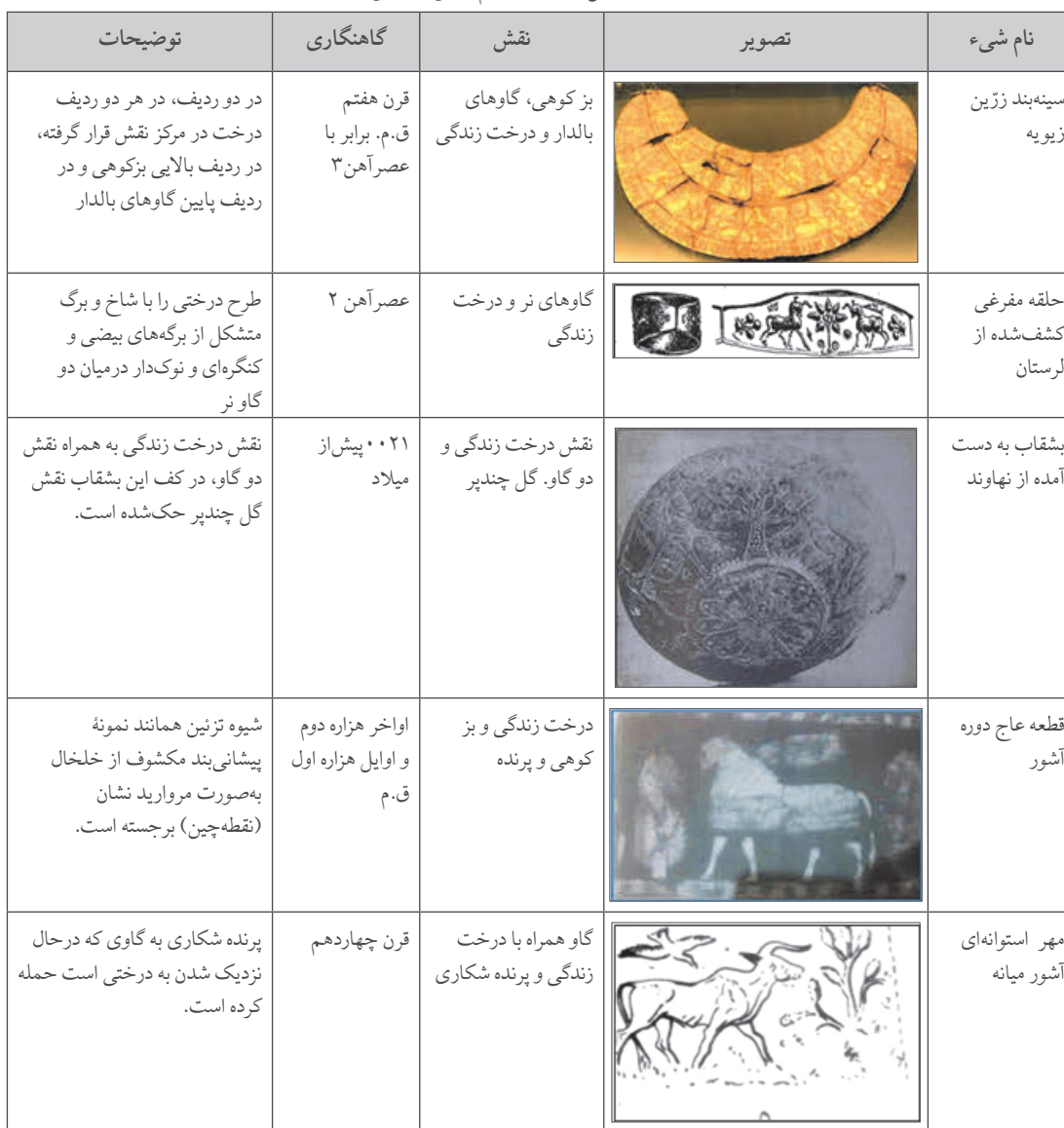
جدول ۱. اشیای قابل مقایسه با جام زرین مشکین شهر

نقش گل چهار پری که در کف این جام وجود دارد، در اشیای دیگر نیز به دست آمده است. نمونه های اشیائی که نقش گل چندپر در کف آن ها از لحاظ بازه زمانی با جام زرین قابل مقایسه و تاریخ گذاری بوده، در محوطه ربط ۲ بوده است. «با توجه به ماهیت تاریخی و محل قرارگیری محوطه ی ربط در حدفاصل دو امپراتوری آشور و اورارتو، تأثیر انکارناپذیر این دو حکومت در محوطه ربط ۲، به وضوح دیده می شود». در محوطه ربط ۲، شیوه طراحی گل های لوتوس، نقش گل و غنچه لوتوس به صورت یک در میان طراحی شده اند (حیدری، ۱۳۸۶: ۲۱۰-۲۱۲).