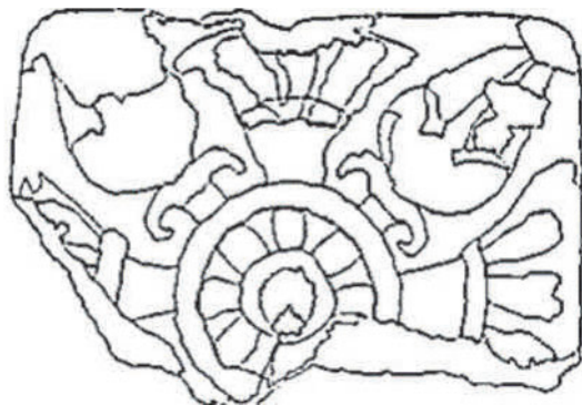
شکل ۴. نقش غنچه و گل لوتوس در آجر ربط

در اینجا، گل‌ها به وسیله بند به هم وصل نیستند، بلکه حول یک شکل گرد چرخ مانند و یا شاید طرح گل گرد لوتوس قرار گرفته‌اند. شیوه بعدی طراحی گل لوتوس در ربط ۲ را می‌توان بر روی گل‌میخ‌ها دید. این شیوه طراحی، هم بر روی گل‌میخ‌های محدب و هم گل‌میخ‌های تخت اجرا شده است. بر سطح نقش گل هشت‌پر با لعاب سفید بر گل‌میخ‌های محدب، عموماً زمینه فیروزه‌ای و یا نقش گل هشت‌پر با لعاب زرد بر زمینه فیروزه‌ای تصویر شده است. (اشکال ۴ و ۵).