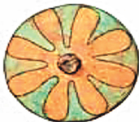
شکل ۵. نقش گل چندپر رزت بر گل‌میخ‌های سفالی محدب و تخت مکشوفه از ربط ۲ (حیدری، ۱۳۸۶: ۲۱۰)

گل رزت یک نقشمایه تزئینی متداول در خاور نزدیک باستان بوده است. تعداد زیادی از این نقش در دوره آشور میانی در معبد آشور دیده شده است. در دوره آشورنو، رزت یک موضوع مرسوم تزئینی بر روی میخ‌بندها، ردهای سلطنتی و دهان‌بند اسب‌ها بود (Green and Blak, 1992: 156). در شکل (۱۹) یک نمونه از گل‌میخ‌های سفالی دوره آشورنو متعلق به قرن ۸ قبل از میلاد نشان داده شده است.