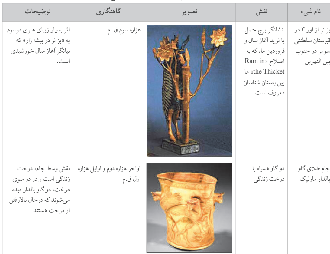
جدول ۱. مقایسه شکل کلی جام و نقش‌ها با نمونه‌های خارج و داخل ایران

در روی تزئینات جام حسنلو تصاویر مختلفی از جمله، تصویر دو گاو نر که در حال حمل خدای ماه هستند دیده می‌شود. این جام نیز از لحاظ جنس و نوع نقش به کار رفته (گاو) با جام زرین مورد بحث قابل مقایسه است. «در صحنه بالایی جام خدای ماه سوار بر ارابه‌هایی که دو گاو نر آن‌ها را می‌کشند، به پهلوان در حال جنگ کمک می‌کند. به فرمان خدای ماه آب باران از او نازل می‌شود و از دهان گاو سیلابی می‌ریزد که صخره هیولا را بشکند. «تیشتر» نازل‌کننده باران تحت فرمان خدای ماه است که جزرومد را از او می‌دانند و بدون قربانی کردن نمی‌تواند کار کند. در کنار او دو نفر برایش قربانی می‌آورند تا او بتواند باران ببارد. خدای ماه در جرگه دو خدای خورشید و زمین است. صحنه بالایی جام نشان از این سه خدای در حال حرکت دارد که هر یک بر ارابه‌هایی نشسته‌اند.» جام معروف به جام کلاردشت نیز یکی از جام‌های زرین است که از لحاظ شکل و جنس فلز به کار رفته با جام مورد بحث قابل مقایسه است. با این تفاوت که در این جام به جای گاو، نقش سر شیر به بدنه جام پرچ شده است. این جام با بلندی ۱۰ سانتی‌متر دارای نقش برجسته سه شیر است که سر آن‌ها به‌صورت جداگانه کار شده و بر روی بدنه جام پرچ شده است. بر روی ران و گونه‌های شیرها نقش گردونه خورشید و نیز تزئینی شبیه دو گل کوچک بر روی پای جلوی آن‌ها دیده می‌شود. بالاوپایین جام با یک ردیف نقش زنجیره‌ای تزئین شده و در کف آن نقش ترنج هندسی محصور در نوار زنجیره‌ای که درون آن گل‌های شش‌پر حک شده، دیده می‌شود. این جام از نظر سبک به دوره‌هایی بین ۱۰۰۰ تا ۶۰۰ پیش از میلاد تعلق دارد ( http://irannationalmuseum.ir ).