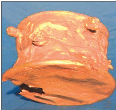
شکل ۳. نقش گل‌های چند پر در کف شیء