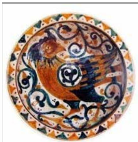
تصویر ۱۹. شیوه تزئین بال پرنده در فال آقکند، اواخر قرن ۵ ه.ق. (Fehreverri, 2000: 89)