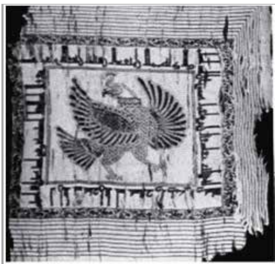
تصویر ۲۰. نحوه طراحی سر پرنده در ابریشم، آل بویه (پوپ، ۱۳۸۴: ۱۲۵)