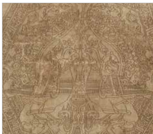
تصویر ۵. دو پرنده رو در رو به صورت متقارن، اوائل دوره آل بویه (موزه کلیولند، شماره ثبت ۱۹۸۲.۲۴)