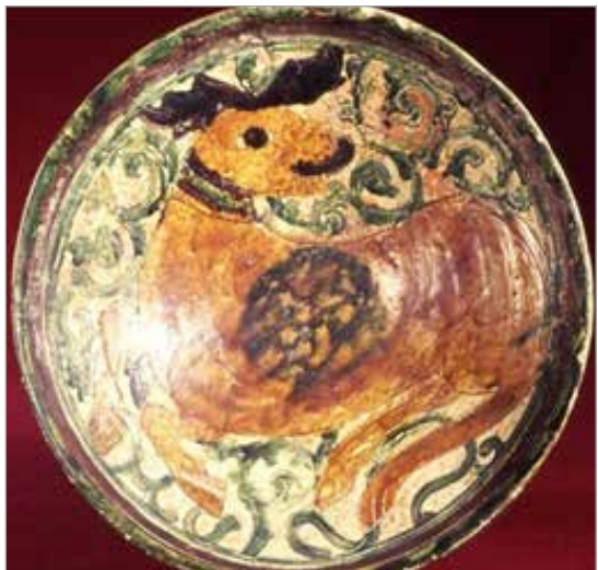
تصویر ۱۵. نقش حیوان در سفال آفکند (Fehervavi, 2000: 40)