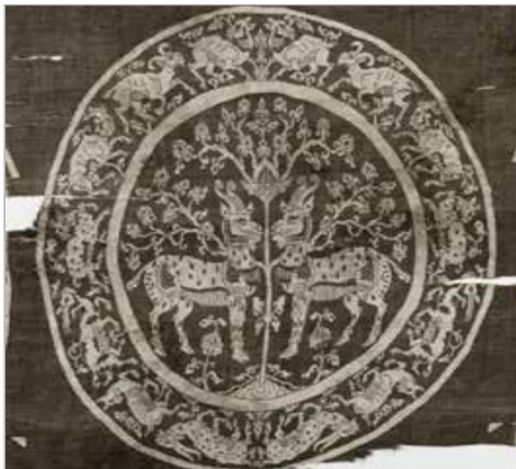
تصویر ۹. نقوش محصور در دایره، بافته قرن ۴ هجری، آل بویه (موزه کلیولند، شماره ثبت ۱۹۵۵.۵۲)

توانسته آنها را به خوبی به بیننده منتقل کند. از این نمونه‌ها، ابریشمینه‌ای است به تاریخ ۳۹۳ ه.ق. با منشأ ری که به عنوان پوشش قبر کاربرد داشته است. نقش این پارچه، دو طاووس بزرگ متقارن رو به درخت زندگی است که چنگال‌هایش در پشت گاوای فرو رفته است. در متن کتیبه آن، برای فرماندار آرزوی بقا و طول عمر شده است (تصویر ۶). نقشی ترکیبی از این دست، در سفال‌های نوع آقکند دیده نمی‌شود و فقط نقش دو پرنده‌ای دیده می‌شود که در دو طرف یک درخت، رو در روی هم کاملاً انتزاعی نقش شده‌اند. مهم‌ترین تفاوتی که این سفالینه با نقوش سایر سفال‌ها دارد، در شکل بال پرنده است، در این نقش برخلاف سایر نمونه‌ها شکل بال‌ها به حالت طبیعی تری نزدیک شده و به جای اینکه بال‌ها بر روی بدن پرنده قرار داده شوند، به بدن چسبیده‌اند (تصویر ۷).