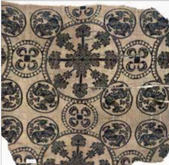
تصویر ۱۴. پارچه با نقش حیوانی در حال فرار، آل بویه (موزه کلیولند، شماره ثبت ۱۹۵۲.۸۳)