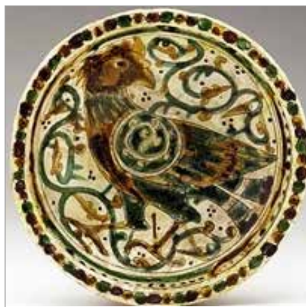
تصویر ۲۳. نقش مرکزی در بدن پرنده، اواخر قرن ۵ ه.ق. (پوپ، ۱۳۸۷: ۶۰۷)