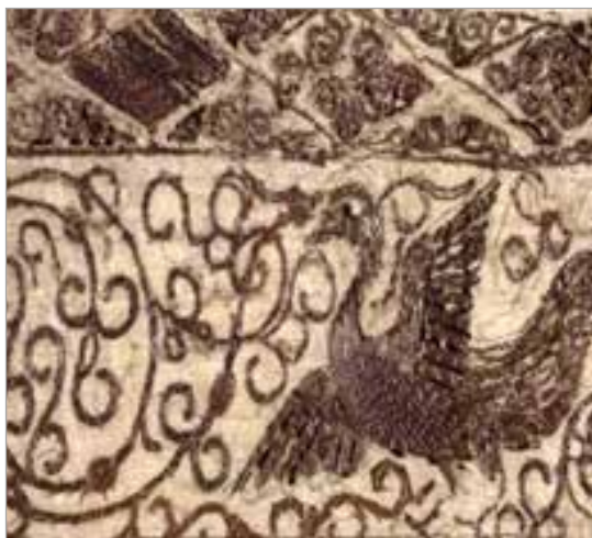
تصویر ۱۶. نقوش اسلیمی در پارچه، سلجوقی (موزه کلیولند، شماره ثبت ۱۹۵۰.۵۳۳)

به تصویر کشیده شده است (تصویر ۱۶). طرز اجرای این نقوش اسلیمی کاملاً با نمونه‌های سفال مطابقت دارد که این نه تنها در نوع اسلیمی‌ها به کار رفته است، بلکه در چگونگی چرخش و گسترش آنها نیز دیده می‌شود؛ این شباهت را می‌توان در زمینه تمامی سفال‌هایی که تاکنون درباره آنها بحث شد، مشاهده نمود (تصویر ۱۷).