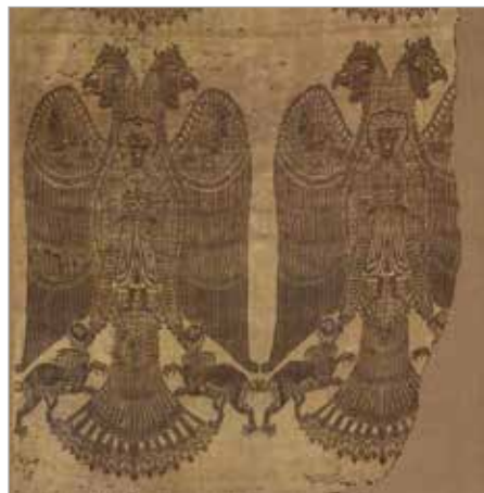
تصویر ۱. پارچه با نقش عقاب؛ مکشوفه از ری (موزه کلیولند ۲ ، شماره ثبت ۱۹۵۳.۴۳۴)

اسلامی، امپراتوری بیزانس، آفریقای شمالی و اسپانیای مسلمان بود. نقش عقاب پیش از اسلام نماد قدرت و بزرگی بود، ولی در دوران اسلامی به نمادی از سرای آخرت و مرگ تغییر یافت (مکداول، ۱۳۷۴: ۱۵۸).