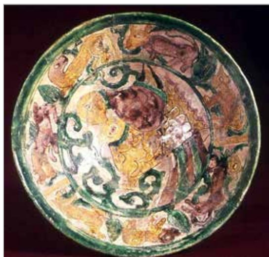
تصویر ۱۱. نقش پرندگان محصور در میان دو دایره (Fehervari, 2000: 40)

یکی از شاخص‌ترین ویژگی سفالینه‌های نوع آقکند و فور بیش از اندازه نقش پرندگان است. این نقوش عمده‌ترین نقش تزئینی این سفال‌ها بوده و بیشتر سفال‌هایی که نقش پرنده را دارند، از بسیاری جهات به هم شبیه‌اند. در رابطه با شباهت‌های نقوش پرنده روی سفال‌های آقکند با منسوجات آل‌بویه و سلجوقی، باید به طراحی غیرطبیعی نقش پرنده در هر دو زمینه پارچه و سفال اشاره کنیم. این ویژگی بارزترین تشابه میان این دو هنر را در این دوره‌ها ارائه می‌دهد، چنین ویژگی بیشتر در بال پرندگان دیده می‌شود. در هر دوی زمینه‌ها، بال‌ها به گونه‌ای طراحی شده‌اند که کاملاً از حالت طبیعی خارج شده و بیش از آنکه شکل یک بال را تداعی کنند، یک بیضی منحنی شکلی را در بیننده مجسم می‌کنند که گویا به بدن پرنده الصاق شده‌اند (تصویرهای ۱۲ و ۱۳). این ویژگی در منسوجات در تصویر ۶ نیز کاملاً پیداست. از طرف دیگر، این ویژگی همیشه به گونه‌ای بوده که بال پرنده به صورت جمع‌شده و چسبیده به بدن کار شده و به‌ندرت، نقشی دیده می‌شود که بال پرنده باز شده نقش شده باشد.