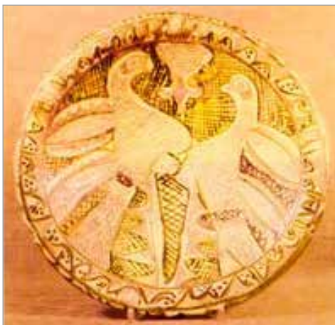
تصویر ۷. سفال آقکند با نقش دو پرنده رودررو، اواخر قرن ۵ ه.ق.