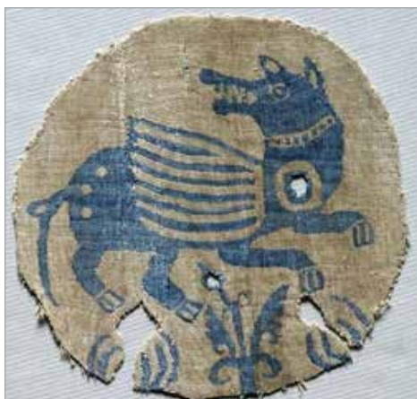
تصویر ۱۸. پارچه سلجوقی، حیوانی ترکیبی با بالیبا تزئین خطوط افقی (موزه کلیولند، شماره ثبت ۱۹۳۹.۴۷)

- به نظر می‌رسد که در طول دو دوره آل‌بویه و سلجوقی، منسوجات از یک زمینه خالی به سوی فضایی پر نقش، پیش رفته‌اند. در زمینه پارچه‌های دوره آل‌بویه تقریباً به‌غیر از نقوش انسانی و حیوانات مختلف و موجودات ترکیبی، کمتر از نقوش گیاهی استفاده شده، ولی این زمینه در دوره سلجوقی با عناصر گیاهی به‌صورت کاملاً تزئینی پر شده است. گذشته از تمامی شباهت‌هایی که عنوان شد، در برخی سفال‌های آقکند نقوش پرندگانی وجود دارد که کاملاً مشخص و بدون تغییرات عمده از منسوجات گرفته شده‌اند و نقش این پرندگان به لحاظ تمام ویژگی‌های بصری از جمله آرایش سر و صورت و چگونگی قرارگیری نقش در فضای زمینه، در هر دو هنر به هم شبیه هستند (تصویرهای ۲۵ و ۲۶).