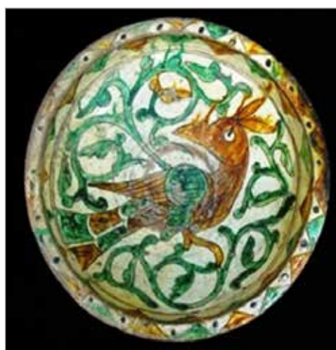
تصویر ۲۱. شکل کاکل و برگشتن سر پرنده به عقب در سفال آقکند (موزه رضا عباسی)