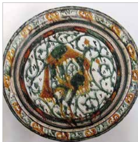
تصویر ۱۷. نقوش اسلیمی سفال آقکند (Watson, 230)