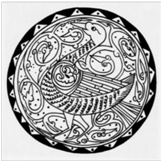
تصویر ۲۶. نقش اردک یا قو در سفال آقکند، قابل مقایسه با تصویر ۲۲، مجموعه شارل ژیله (پوپ، ۱۳۸۷: ۶۰۹)