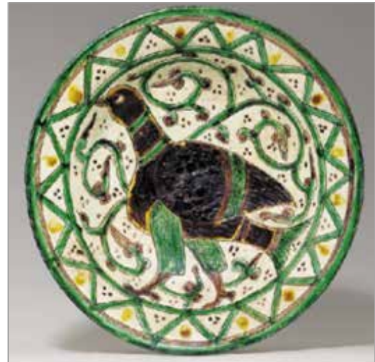
تصویر ۱۳. طرز قرارگیری بال در نقش پرنده، سفال آفکند، قرن ۵۶ ق. (مجموعه کریستی، شماره ثبت ۶۴۲۸.۲۵۶)

- استفاده از نقوش گیاهی و جداکردن نقش‌ها با یک خط افقی، این پرندگان را بیش از پیش به هم شبیه می‌کند. در مورد نقوش روی منسوجات نکته‌ای حائز اهمیت است: اضافه کردن یک بال به یک حیوان بی‌بال و آفرینش حیوانی ترکیبی است. با اینکه حیوانی کاملاً شبیه به این نقوش بر روی سفال‌ها دیده نمی‌شود ولی طرز منقوش ساختن این بال