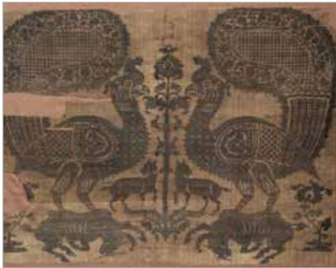
تصویر ۶. حیوانات متقارن و رودررو، قرن ۵ هجری، ری (Pope, 1967؛ موزه کلیولند، شماره ثبت ۱۹۶۱.۳۴)

نیز در یکی از پارچه‌های دوره آل بویه با همان سبک و سیاق دیده می‌شود (تصویر ۹). نکته جالب توجه درباره برخی از این دایره‌ها این است، در مواردی که دو دایره نقش را احاطه کرده، در فضای بین دو دایره نقوش کتیبه‌ای و یا نقوش حیوانی نیز به کار می‌رفته است، چنین ویژگی‌ای در اکثر سفال‌های آقکند نیز نمایان است. شاید اگر برای سفالینه‌های نوع آقکند از میان