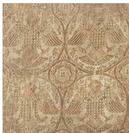
تصویر ۲. نقش پرنده از روبرو، اواسط قرن ۴ هجری (موزه کلیولند، شماره ثبت ۱۹۶۸.۲۳۳)