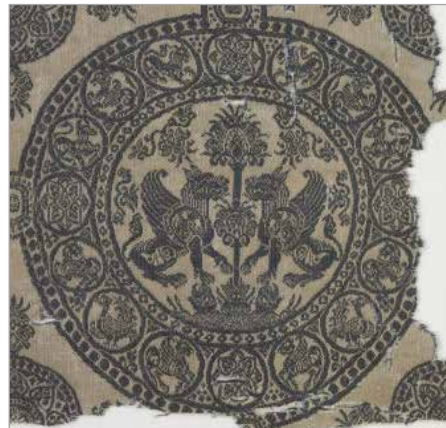
تصویر ۸. پارچه دوره سلجوقی، نقوش محصور شده در دایره (موزه کلیولند، شماره ثبت ۱۹۶۶.۱۳۶)

موضوع قابل بحث دیگر، فضایی است که نقوش در آن جای گرفته‌اند. بیشتر نقوش تزئینی روی پارچه‌های آل بویه، به وسیله قاب دایره‌ای شکل دربر گرفته شده‌اند. علاقه به انحصار نقش‌ها در شکل‌های هندسی که در دوره ساسانی مشهود بود، در دوران آل بویه نیز وجود داشت و استاد طراح پارچه در کنار ترسیم این نقوش، طرح‌های ظریف و گل و بته‌های مارپیچی را هم به کار می‌برد. این ویژگی را در بیشتر منسوجات این دوره می‌توان مشاهده نمود (پوپ، ۱۳۸۴: ۲۸). نقش یکی از منسوجات دوره سلجوقی، دو شیر را در حال نگهبانی درخت زندگی نشان می‌دهد که از بالای این درخت دو پرنده به پرواز درآمده و تخم نعمت بر زمین می‌پاشند (همان: ۹۹)؛ در نمونه دیگر، دو شیر در دو طرف درخت زندگی در داخل دو دایره محدود شده که بین آنها نیز با نقوش حیوانی و گیاهی تزئین یافته است (تصویر ۸). این ویژگی، قبل از این دوره