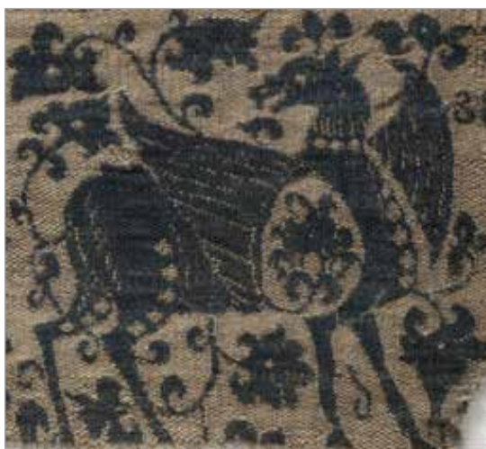
تصویر ۲۲. نقش مرکزی در بدن نقش حیوانی، سلجوقی (موزه کلیولند، شماره ثبت ۱۹۶۶.۱۳۳)