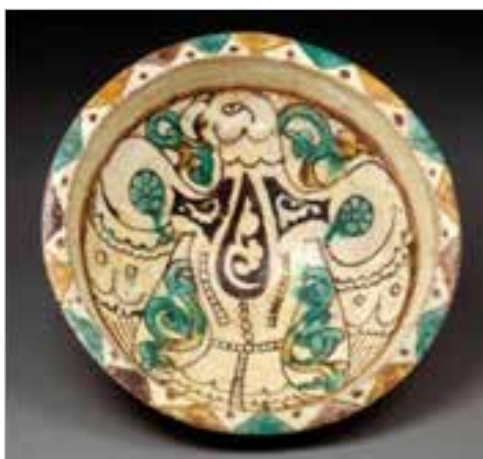
تصویر ۳. تمام‌رخ نمایی در سفال آقکند، اواخر قرن ۵ و اوایل قرن ۶ ه.ق. (موزه ویکتوریا و آلبرت ۳ ، C.725.1923)

پارچه‌های آل بویه به نقش‌اندازی‌های متقارن و متقابل معروف‌اند، این روش کار آنها هرچند به تقلید از پارچه‌های ساسانی است لیکن اضافه کردن کتیبه‌های کوفی و ترکیب‌بندی موفق نقش و نوشتار و استفاده از هر دو موضوع به‌عنوان تزئین، حکایت از توان بالای هنر آل بویه در آمیختن تصویر و نوشتار دارد (شایسته‌فر و موسوی‌لر، ۱۳۸۲: ۲۵). این ویژگی مهم، عامل دیگری است که شباهت برخی نقوش سفالینه‌های نوع آقکند را با نقوش پارچه‌های آل بویه و سلجوقی نشان می‌دهد، از جمله می‌توان به نقوشی اشاره نمود که موجوداتی را در دو طرف یک درخت نشان می‌دهد که در بیشتر مواقع این درخت سرو است. نقوش مذکور بر روی پارچه‌ها به شیوه ماهرانه‌ای به تصویر کشیده شده (تصویر ۵)، در حالی که در سفال‌ها کاملاً ابتدائی و با یک تقارن نامساوی دیده می‌شود. در برخی از پارچه‌ها با ترکیب نقوش حیوانات مختلف، هنرمند بافنده در حال بیان کردن موضوعاتی است که با چیره‌دستی