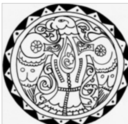
تصویر ۴. سفال آقکند، اواخر قرن ۵ و اوایل قرن ۶ ه.ق. (پوپ، ۱۳۸۷: ۶۰۷)