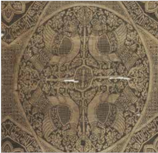
تصویر ۱۲. پرنده در منسوجات، نحوه قرارگیری بال، اواخر آل بویه (موزه کلیولند، شماره ثبت ۱۹۶۴.۵۳۸)