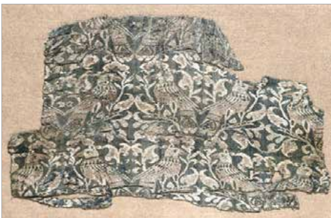
تصویر ۲۴. کاکل برگی شکل و شیوه تزئین نوک در منسوجات، ری، قرن پنجم (موزه کلیولند، شماره ثبت ۱۹۴۸.۵۰۱)