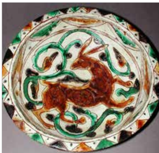
تصویر ۱۰. نقش حیوان در سفال، دو دایره که نقش را محصور کرده و فضای میانی آنها منقوش است، قرن ۶ ه.ق. (موزه فیتز، ۱۹۴۶-۱۵۳-oc)