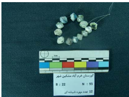
تصویر ۴- مهره‌های شیشه‌ای سردوکی شکل (نگارندگان، ۱۳۹۱)

به‌حساب می‌آیند. شاید ماده خام آن‌ها یا روش تولید آن‌ها، باعث کم‌ساخته شدن و کمیاب بودن آن‌ها باشد. ماده اولیه یا خام برای تهیه سیلیسیم - که مهم‌ترین عنصر تشکیل‌دهنده انواع شیشه‌هاست - کوارتز می‌باشد که معمولاً از شن رودخانه‌ها به‌دست می‌آید. مواد قشری دانه‌های شن و هم‌چنین ناخالصی‌های معدنی موجود کوارتز، غالباً به‌مقادیر کم یا زیاد در ترکیب شیشه داخل می‌شوند؛ چنان‌که مقدار جزئی آهن، آلومینیوم و منگنز و تیتان که به‌صورت اکسید (ترکیب با اکسیژن)، ممکن است از همین راه وارد شده باشند. لازم به ذکر است که کم و زیاد بودن همین مواد در رنگ شیشه‌های تولید شده، کاملاً موثر است. این نکته را نیز خاطر نشان کنیم که چون به‌طور عمد، ماده رنگی به خمیرمایه این‌گونه شیشه‌ها اضافه نمی‌شود، شیشه‌های تولید شده با وجود رنگ جزئی آن‌ها، در گروه شیشه‌های بی‌رنگ قرار داده می‌شوند. تعداد ۱۲ مهره شیشه‌ای، تقریباً سر دوکی شکل، در رنگ‌های آبی، سبز و قهوه‌ای تیره به‌دست آمد. این مهره‌ها، مختلف‌الاندازه هستند و سوراخ نخ‌گذارشان نیز به‌صورت کامل نیست و بیضی است. بزرگ‌ترین این مهره‌ها، به‌طول ۱۲ و عرض ۹ و قطر سوراخ ۲ میلی‌متر است. کوچک‌ترین آن‌ها، به‌طول ۱۰ و عرض ۷ و قطر سوراخ ۴ میلی‌متر است. به‌نظر می‌رسد، رنگ‌های مختلف این مهره‌ها، به‌علت وجود ناخالصی‌هایی باشد که در خمیره این شیشه‌ها، وجود داشته است (تصویر ۴).