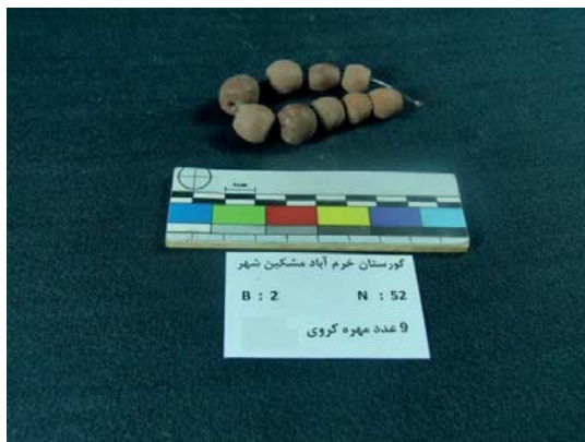
تصویر ۱۰- مهره‌های گلی گروهی شکل (نگارندگان، ۱۳۹۱).

از دیگر مهره‌های جالب توجه سنگی، ۴ مهره در کوهی بودند، که به شکل استوانه‌ای هستند و عرض آن‌ها در قسمت میانی، بیش‌تر از دو سر آن می‌باشد. رنگ این مهره‌ها، سفید و تراش آن‌ها چندان مطلوب نمی‌باشد. این مهره‌ها، مختلف‌الاندازه هستند؛ به گونه‌ای که، بزرگ‌ترین آن‌ها به طول ۶ و عرض ۵ و قطر سوراخ ۱ میلی‌متر و کوچک‌ترین این مهره‌ها، به طول ۶ و عرض ۴ و قطر سوراخ ۱ میلی‌متر است (تصویر ۹).