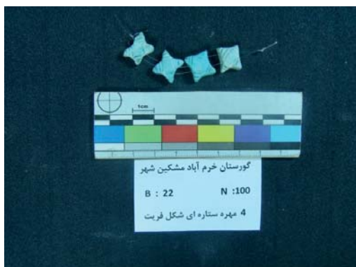
تصویر ۱۵- مهره‌های فریت ستاره‌ای شکل (نگارندگان، ۱۳۹۱).

از دیگر نمونه‌ها، ۴ مهره فریت ستاره‌ای شکل است، که لعابی به رنگ آبی فیروزه‌ای دارند؛ این مهره‌ها، به شکل مربع هستند-که در زوایا، کمی بیرون آمده- و به شکل یک ستاره چهارپر، به نظر می‌آیند. بر روی مهره‌ها و زوایای آن، نقوشی شامل خطوط کنده و هاشور خورده و در قسمت میانی مهره، یک نقش لوزی قابل مشاهده است. این مهره‌های مختلف‌الاندازه، دارای سوراخ نخ‌گذار نیز می‌باشند. بزرگ‌ترین این مهره‌ها، به طول ۱۱ و عرض ۱۱ و قطر ۶ و قطر سوراخ ۱ میلی‌متر و کوچک‌ترین آن‌ها به طول ۱۱، عرض ۹، قطر ۵ و قطر سوراخ ۱ میلی‌متر است (تصویر ۱۵).