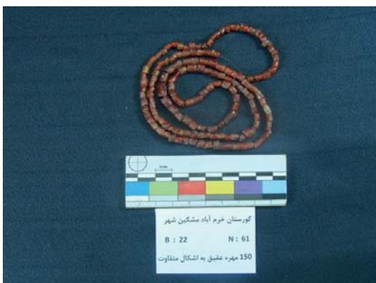
تصویر ۷- مهره‌های عقیق استوانه‌ای و دیسکی (نگارندگان، ۱۳۹۱).

علاوه بر این، تعداد ۱۵ مهره کروی شکل - که در ابعاد مختلف بودند- نیز از این محوطه به دست آمد. رنگ این مهره‌ها، از قهوه‌ای روشن و تیره تا زرشکی متغیر است و شیوه تراش آن‌ها نیز چندان مطلوب نیست؛ به گونه‌ای که، بعضاً شکل آن‌ها به صورت کروی کامل نیست. سوراخ نخ‌گذار این مهره‌ها، در قسمت میانی قرار دارد و در دو سر آن‌ها، قطر سوراخ بیش‌تر از قسمت میانی است. بزرگ‌ترین آن‌ها، به طول ۱۳ و عرض ۱۰ و قطر سوراخ ۳ میلی‌متر و کوچک‌ترین آن‌ها به طول ۸ و عرض ۶ و قطر سوراخ ۲ میلی‌متر است (تصویر ۸).