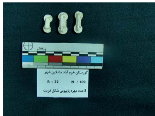
تصویر ۱۷- مهره‌های فریت پایبونی شکل (نگارندگان، ۱۳۹۱).

از نمونه‌های بسیار جالب توجه، ۳ مهره فریت به شکل پایبونی است که در قسمت پشت، یک پایه مکعب مستطیل شکل و دو سوراخ نخ‌گذار دارند. سمت فوقانی این مهره‌ها، از دو قسمت مدور تشکیل یافته که قسمت میانی این دو قسمت مدور، یعنی دو طرف پایبون، به وسیله سه خط برجسته - که در جهت سوراخ نخ‌گذاری کشیده شده - تزیین شده است. این مهره‌ها، بدون لعاب و به رنگ سفید هستند. این مهره - ها، به طول ۲۶، با بیش‌ترین عرض ۱۱ و کم‌ترین عرض ۹ و قطر سوراخ ۲ میلی‌متر است (تصویر ۱۶).