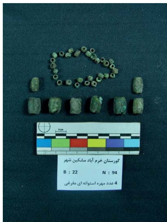
تصویر ۳- مهره‌های مفرغی گورستان خرم‌آباد (نگارندگان، ۱۳۹۱).

این مهره‌های استوانه‌ای مفرغی، به‌صورت ورقه‌ای ساخته شده‌اند و دو سر ورقه‌ها، بر روی هم خم شده و لبه‌ها در کنار یک‌دیگر قرار گرفته‌اند؛ به‌گونه‌ای که، قسمت میانی آن‌ها، عریض‌تر از دو سر آن‌ها می‌باشد. بزرگ‌ترین این مهره‌ها، به‌طول ۱۶ و عرض ۱۲ و قطر سوراخ ۸ میلی‌متر ساخته شده است و کوچک‌ترین آن‌ها، به‌طول ۴ و عرض ۳ و قطر سوراخ ۳ میلی‌متر است (تصویر ۳).