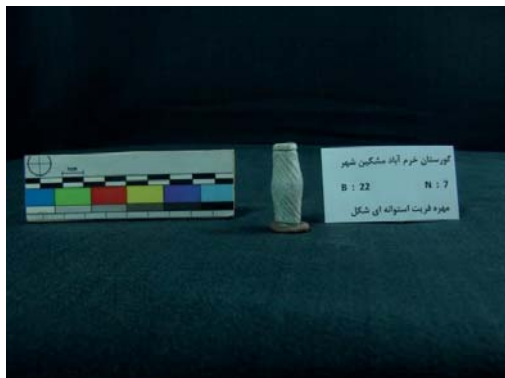
تصویر ۱۸- نمونه‌ای از یک مهره فریت استوانه‌ای (نگارندگان، ۱۳۹۱).

از اشکال رایج دیگر در این گورستان، تعداد ۱۵۰ مهره فریت بود که از قسمت‌های مختلف گور، به دست آمده است. این مهره‌ها، از روبه‌رو به شکل مثلث هستند، که در راس آن و در قسمت انتهایی دارای خمیدگی و قوس می‌باشند؛ به گونه‌ای که، سوراخ نخ‌گذار این مهره - ها، در راس این مهره‌ها قرار دارند. هر چه از راس مهره‌ها، به قسمت پایین می‌رویم، از ضخامت آن‌ها کاسته می‌شود. بر روی برخی از این مهره‌ها و بر روی هر پنج ضلع آن‌ها، اشکال مختلفی از جمله خطوط افقی، عمودی و مایل و خطوط متقاطع و اریب و هاشور دیده می‌شود. برخی از این خطوط، عمق بیش‌تری دارند. این مهره‌ها، به رنگ آبی فیروزه‌ای هستند و شفافیت خود را تا به امروز حفظ نموده‌اند. بزرگ‌ترین این مهره‌ها، به طول ۱۹ و عرض در راس، ۸ و در انتها، ۳ و قطر سوراخ، ۱ میلی‌متر است؛ و کوچک‌ترین آن‌ها، به طول ۹ و عرض در راس، ۵ و در قسمت انتهایی، ۳ و قطر سوراخ، ۱ میلی‌متر است (تصویر ۱۹).