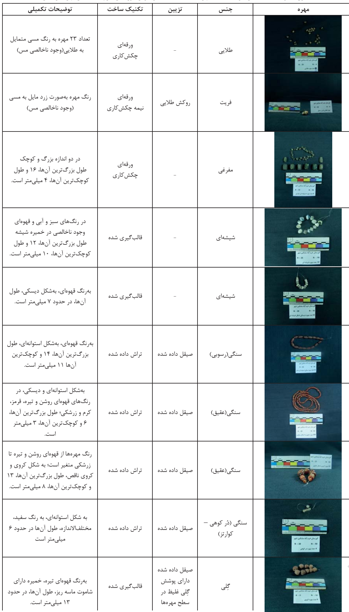
جدول ۱. توضیحات اختصاری و دسته‌بندی مهره‌های به‌دست آمده از کاوش گورستان خرم‌آباد مشگین‌شهر (نگارندگان، ۱۳۹۷).