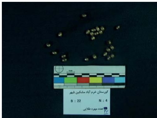
تصویر ۱- مهره‌های طلایی کروی شکل (نگارندگان، ۱۳۹۱).

آمده که به شکل استوانه‌ای هستند و در قسمت میانی، عرض بیش‌تری نسبت به دو سر خود دارند. این مهره‌ها، به شکل دانه‌های تسبیح بوده و به شیوه بسیار ظریفی ساخته شده‌اند. رنگ آن‌ها مسی مایل به طلایی بوده است که به احتمال، به دلیل وجود ناخالصی مس در درون آن‌ها، می‌باشد. این مهره‌ها با تکنیک چکش‌کاری ساخته شده و به احتمال بر روی یک‌سری مهره‌های فریت، کشیده شده‌اند. میانگین طول این مهره‌ها ۶ و عرض ۵ میلی‌متر و قطر سوراخ آن‌ها، ۳ میلی‌متر است (تصویر ۱).