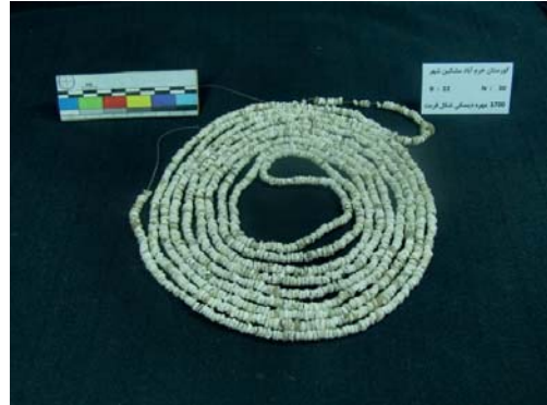
تصویر ۲۰- مهره‌های فریت دیسکی شکل (نگارندگان، ۱۳۹۱).

قالب‌گیری شده و پیش از خشک شدن، برش داده شده‌اند. این مهره‌ها، بدون لعاب و سفیدرنگ می‌باشند. بزرگ‌ترین آن، به طول ۶ و عرض ۳ و قطر سوراخ ۲ میلی‌متر است؛ و کوچک‌ترین آن‌ها به طول ۴ و عرض ۲ و قطر سوراخ ۱ میلی‌متر است. این مهره‌ها، در عمق ۱۴۵-۱۹۶ سانتی‌متری از بالاترین سطح گور، به دست آمده‌اند (تصویر ۲۰).