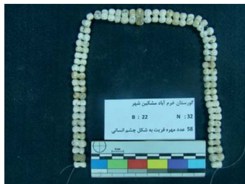
تصویر ۲۱- مهره‌های فریت به شکل دو چشم (نگارندگان، ۱۳۹۱).

آخرین و جالب‌ترین نمونه برای ذکر، تعداد ۵۸ مهره فریت است که از روبه‌رو، به شکل دو چشم انسان به نظر می‌آیند و از دو مهره کروی به هم چسبیده ساخته شده‌اند که یک قسمت آن، تخت و طرف دیگر، به صورت کروی است. این مهره‌ها، در قسمت میانی دارای دو سوراخ نخ‌گذار هستند. این مهره‌ها، به رنگ سفید و بدون لعاب هستند و در قسمت میانی، یعنی در محل اتصال این مهره‌ها به یک‌دیگر، دو خط کنده دیده می‌شود. طول بزرگ‌ترین این مهره‌ها، ۱۲ و عرض آن‌ها بر روی مهره‌ها، ۶ و در قسمت میانی، ۴ میلی‌متر و قطر سوراخ نخ‌گذار آن ۱ میلی‌متر است. کوچک‌ترین آن‌ها به طول ۱۰ و عرض در روی مهره‌ها، ۶ و در قسمت میانی، ۵ میلی‌متر می‌باشد (تصویر ۲۱).