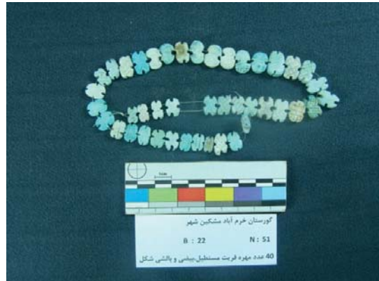
تصویر ۱۲- مهره‌های فریت مختلف‌الشکل (نگارندگان، ۱۳۹۱).