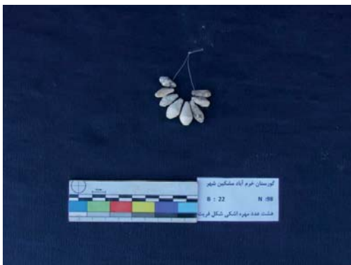
تصویر ۱۴- مهره‌های فریت اشکی شکل (نگارندگان، ۱۳۹۱).

از دیگر نمونه‌ها، ۴ مهره فریت ستاره‌ای شکل است، که لعابی به رنگ آبی فیروزه‌ای دارند؛ این مهره‌ها، به شکل مربع هستند-که در زوایا، کمی بیرون آمده- و به شکل یک ستاره چهارپر، به نظر می‌آیند. بر روی مهره‌ها و زوایای آن، نقوشی شامل خطوط کنده و هاشور خورده و در قسمت میانی مهره، یک نقش لوزی قابل مشاهده است. این مهره‌های مختلف‌الاندازه، دارای سوراخ نخ‌گذار نیز می‌باشند. بزرگ‌ترین این مهره‌ها، به طول ۱۱ و عرض ۱۱ و قطر ۶ و قطر سوراخ ۱ میلی‌متر و کوچک‌ترین آن‌ها به طول ۱۱، عرض ۹، قطر ۵ و قطر سوراخ ۱ میلی‌متر است (تصویر ۱۵).