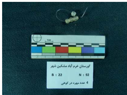
تصویر ۹- مهره‌های سنگی از جنس در کوهی (نگارندگان، ۱۳۹۱).

نمونه دیگر، تعداد ۷۵۰۰ مهره استوانه‌ای است که در قسمت‌های مختلف گور، به دست آمده است. این مهره‌ها، استوانه‌ای، در ابعاد مختلف و دارای لعابی به رنگ آبی فیروزه‌ای هستند. این مهره‌ها، به شکل رولی قالب‌گیری شده و پیش از خشک شدن، برش داده شده‌اند، به گونه‌ای که، برخی از این مهره‌ها، از یک‌دیگر جدا نشده‌اند. طول این مهره‌ها ۳ و عرض ۲ و قطر سوراخ ۱ میلی‌متر است (تصویر ۱۱).