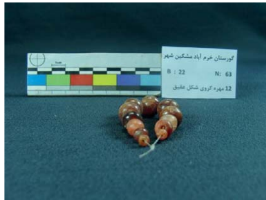
تصویر ۸- مهره‌های عقیق گروهی شکل (نگارندگان، ۱۳۹۱).

می‌رسد به صورت قالبی ساخته شده و بعد از ساخت، حرارت دیده شده‌اند. در خمیره این مهره‌ها، ذرات و دانه‌های ماسه ریز دیده می‌شود. بر روی این مهره‌ها، پوشش گلی غلیظ نیز دیده می‌شود. دو سر مهره‌ها، به صورت تخت است. بزرگ‌ترین این مهره‌ها، به طول ۱۳ با بیش‌ترین عرض ۱۴ و کم‌ترین عرض ۱۰ و قطر سوراخ ۲ میلی‌متر است. کوچک‌ترین آن‌ها به طول ۱۳ با بیش‌ترین عرض ۱۱ و کم‌ترین عرض ۹ و قطر سوراخ ۳ میلی‌متر است (تصویر ۸).