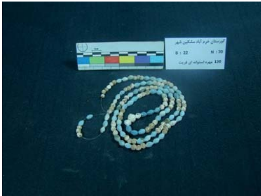
تصویر ۱۳- مهره‌های فریت استوانه‌ای شکل (نگارندگان، ۱۳۹۱).

است. این مهره‌های فریت، دارای دو سوراخ نخ‌گذار می‌باشند. در چهار طرف آن‌ها، چهار شیار فرورفته دیده می‌شود. بر روی این مهره‌ها، بعضاً یک‌سری نقوش کنده، شامل خطوط هاشور نیز قابل مشاهده است. این مهره‌ها، بادقت بسیار زیادی ساخته شده‌اند؛ به گونه‌ای که، همگی دارای لعابی به رنگ آبی فیروزه‌ای هستند. طول بزرگ‌ترین آن‌ها ۱۵ و عرض ۱۷ و قطر سوراخ ۱ میلی‌متر است (تصویر ۱۲).