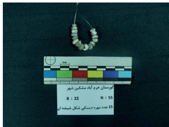
تصویر ۵- مهره‌های شیشه‌ای دیسکی شکل (نگارندگان، ۱۳۹۱).

کامل نیستند و به صورت بیضی می‌باشند. طول این مهره‌ها ۷ و عرض ۴ و بیش‌ترین قطر سوراخ، ۲ و کم‌ترین قطر سوراخ، ۱ میلی‌متر است (تصویر ۵).