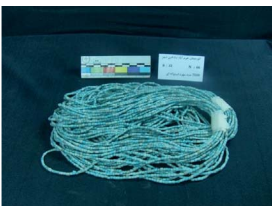
تصویر ۱۱- مهره‌های گلی استوانه‌ای شکل (نگارندگان، ۱۳۹۱).

تعداد ۹ مهره گلی گروهی شکل، از این محوطه به دست آمده که در قسمت میانی، دارای یک برجستگی می‌باشند. این مهره‌ها، به رنگ قهوه‌ای تیره بوده و به نظر