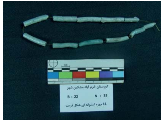
تصویر ۱۶- مهره‌های فریت استوانه‌ای (نگارندگان، ۱۳۹۱).

نمونه دیگر، تعداد ۱۱ مهره فریت استوانه‌ای شکل است که به صورت صاف و راست نیستند و در بدنه خمیدگی و قوس دارند. این مهره‌ها، دارای لعابی به رنگ آبی فیروزه‌ای هستند و هیچ‌گونه تزیینی در سطح خود ندارند. طول این مهره‌ها، ۳۳ و عرض ۶ و قطر سوراخ نخ‌گذار ۳ میلی‌متر است (تصویر ۱۶).