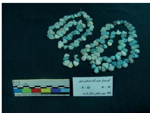
تصویر ۱۹- مهره‌های فریت مثلثی شکل (نگارندگان، ۱۳۹۱).

از شکننده‌ترین و ریزترین مهره‌ها، می‌توان به تعداد ۱۷۰۰ مهره فریت دیسکی شکل، اشاره نمود. این مهره‌های مختلف‌الاندازه به صورت رولی ساخته و