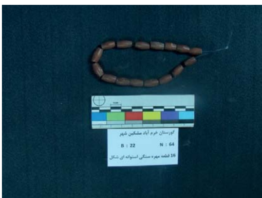
تصویر ۶- مهره‌های سنگی رسوبی (نگارندگان، ۱۳۹۱).

مطلوبی ندارند. این یافته‌ها، در رنگ‌های مختلف قهوه‌ای روشن و تیره و قرمز، کرم و زرشکی ساخته شده‌اند. سوراخ نخ‌گذار این مهره‌ها در قسمت میانی آن‌ها، قرار ندارد. برخی از این مهره‌ها در قسمت میانی، دارای ضخامت بیش‌تری نسبت به دو سر آن هستند. بزرگ‌ترین این مهره‌ها، به طول ۶ و عرض ۶ و قطر سوراخ ۱ میلی‌متر است. کوچک‌ترین این مهره‌ها، به طول ۳ و عرض ۲ و قطر سوراخ ۰/۵ میلی‌متر است (تصویر ۷).